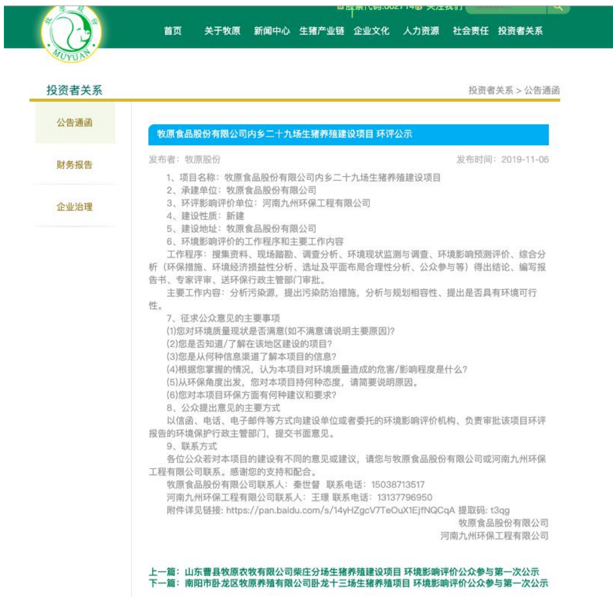
图2.1-1 首次环境影响评价信息公示截图