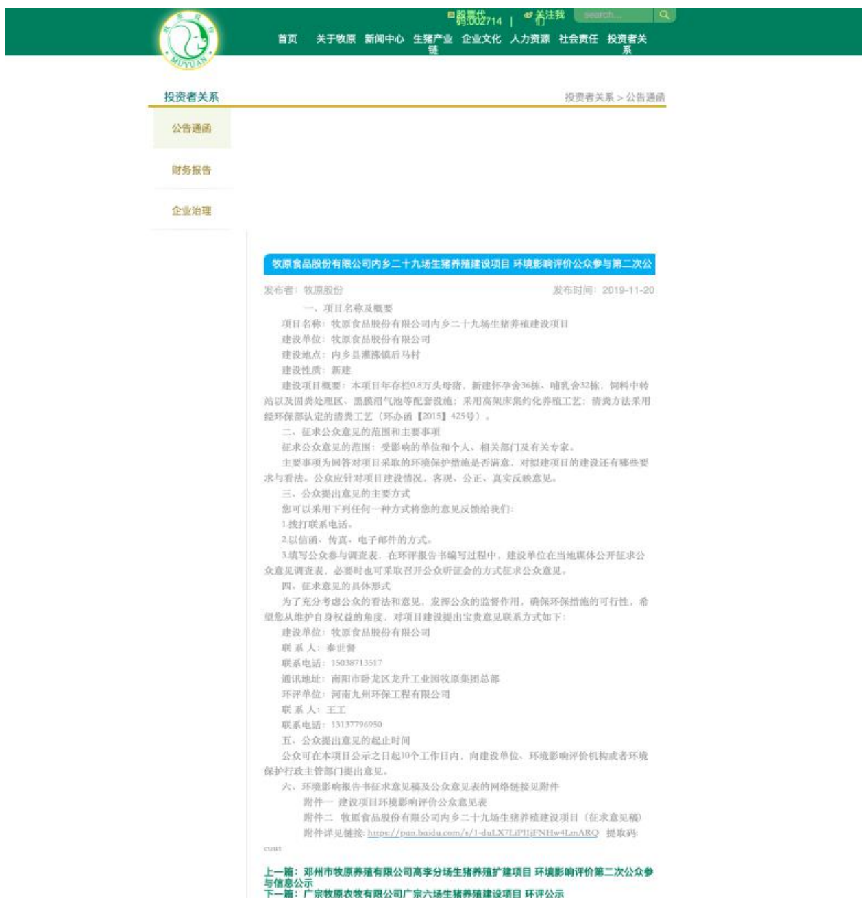
图3.2-1 第二次信息网络公示截图