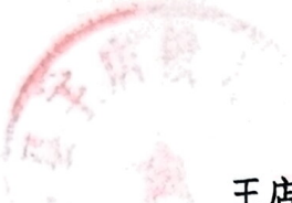
王店镇水库防汛“三个责任人”名单